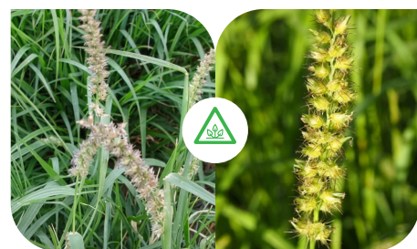
CAPIM-CARRAPICHO [CENCHRUS ECHINATUS]