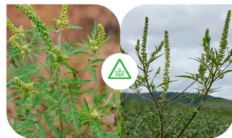
CRAVORANA/LOSNA [AMBROSIA ARTEMISIIFOLIA]