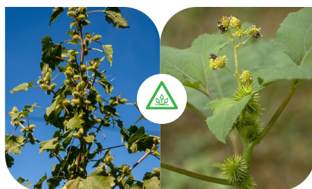
CARRAPICHÃO [XANTHIUM STRUMARIUM]