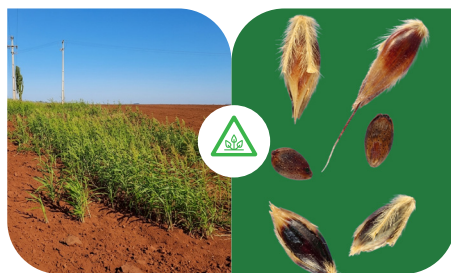
CAPIM-MASSAMBARÁ [SORGHUM HALEPENSE]

É fundamental vigiar constantemente nossas lavouras. O olho do dono, aliado à nossa técnica, é o que protege o patrimônio.