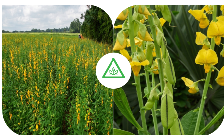
CROTALÁRIA [CROTALARIA SPP.]

O Departamento Técnico da cooperativa esta preparado para prestar assistência aos produtores, atuando na orientação e recomendação de estratégias de manejo para prevenção e controle dos riscos associados a essas espécies.